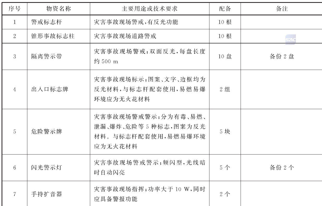
表 8 第一类危险化学品单位警戒器材配备要求