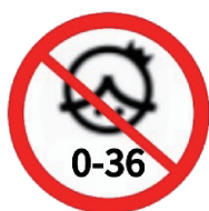
图 A.4 年龄警示图标示例 2