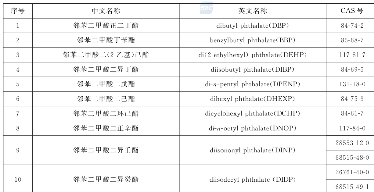
表 C.1 限用的增塑剂信息