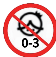
图 A.5 年龄警示图标示例 3