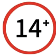
图 A.1 成人首饰标识图形

对于可能给儿童造成潜在危险的成人首饰,在其标签或其他标识物中宜有类似以下警示:“警告:不适合 14 周岁以下儿童。”或采用图 A.1 图标代替,但“警告”或“注意”一词宜随该图标一起使用。