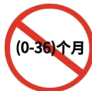
图 A.3 年龄警示图标示例 1

儿童首饰对使用者的限制宜至少包括使用者的最小或最大年龄限制,例如:“警告! 不适合 36 个月(3 岁)以下儿童佩戴。”或采用图 A.3~图 A.5 图标代替,但“警告”一词宜随该图标一起使用。